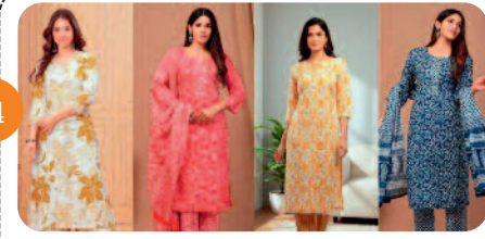
सिंपल लुक में चाहिए ट्रेडी...